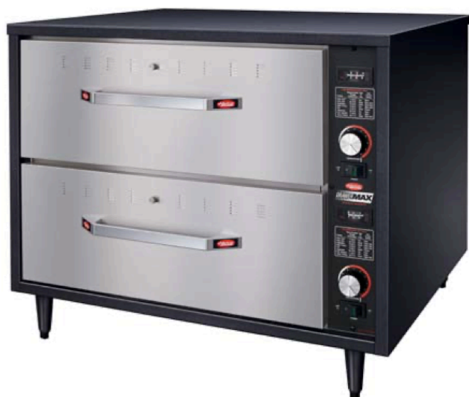
Тепловой шкаф Hatco HDM-2