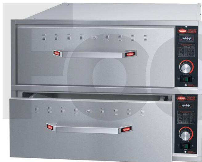
Тепловой шкаф Hatco HDM-2B

Храните теплыми и свежими любые продукты от мяса и овощей до булочек в тепловых шкафах Hatco. Температура и влажность каждого ящика настраиваются независимо, что позволяет одновременно хранить совершенно разные продукты.